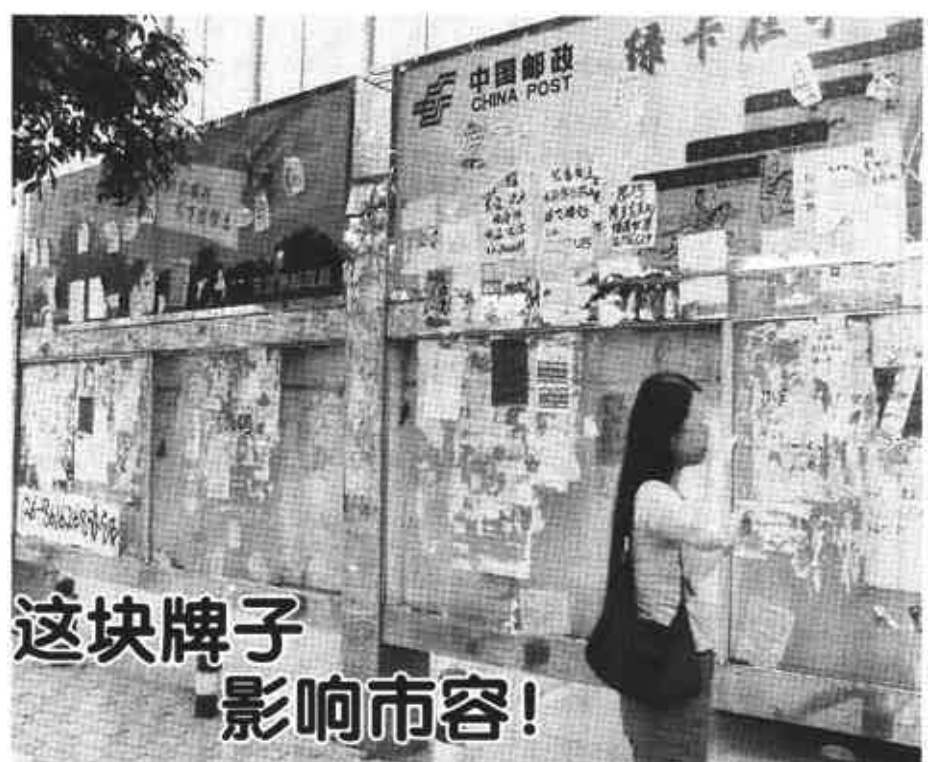
这块牌子影响市容! 位于西城济南路邮政局门前的快宣传牌,由于管理不到位,长期成为一块乱贴乱划牌。上面不仅坏了好几块玻璃,而且贴满了

曾几何时,分数的指挥棒使我们走入应试式教育的误区。以至考了考多少分?排了多少名?成为家庭、学校、社会包括学生本人检验和评价教育成果的首要问题。基于这样一种氛围,不管那位老师出的题目是如何紧扣学生生活、学习和成长的实际,我们都不难推测试结果的尴尬和无奈。令人欣喜的是,以分数高低论英雄的应试式教育,弊端多多,已成共识。走出应试式教育,全面推进素质教育,是时代的要求和呼唤。而以培养学生创新精神和实践能力为核心,使