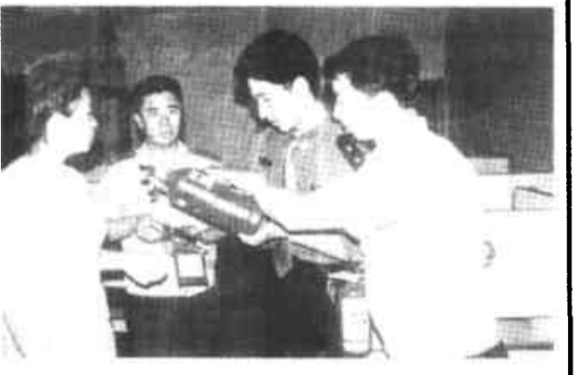
近日,垦利县消防大队对城区大型网吧的消防安全进行了突击检查,提高网吧从业人员消防安全意识,杜绝火灾隐患。(吕希华)

虽然她还是一个学生,还是一个十八岁的孩子,但通过这场劫难的考验,她变得坚强、成熟了。她下定了决心:这个家就是条漏船,也要以爱为篙撑下去,必须和命运搏斗一次。她相信,只要走过黑暗,就会有黎明。(玉平 大勇)