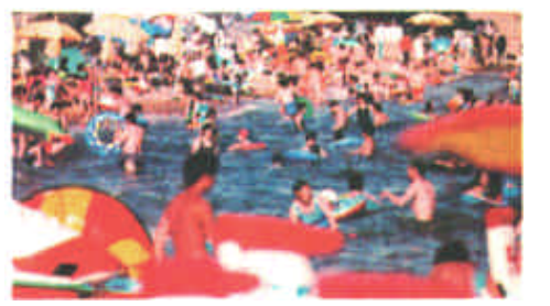
盛夏到来，河北省秦皇岛北戴河旅游区逐渐进入旅游旺季。预计北戴河旅游区2002年将迎来旅游者800万人次，比2001年同期增长10%。这是游人如织的北戴河老虎石海滨浴场。