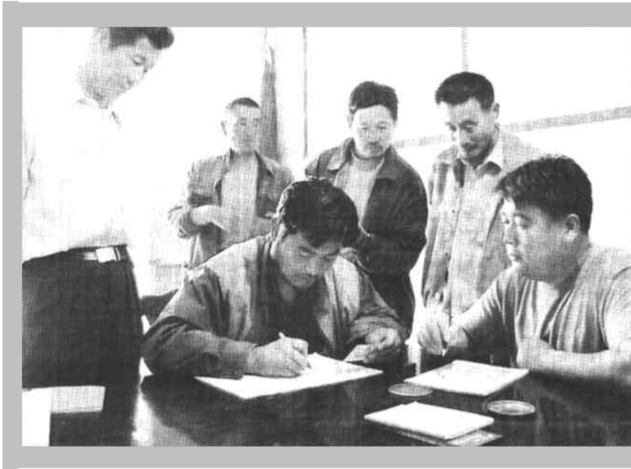
东营区牛庄镇西范信用社积极支持农业生产 近日经过充分考察论证后，为陈庄村35户养殖户的农民发放贷款350万元，扶持了奶牛业的发展，深受农民欢迎。图为信用社工作人员正在陈庄村为农民发放贷款。

口碑如镜，能聚焦出无穷的约束力。可以说口碑的约束，发挥了法律不可替代的作用。一个注重自己口碑的人，做事的时候就必然有所顾及，小心谨慎，时刻珍惜口碑，就必然认真真对待党的事业，对工作精益求精，处处争做先锋。只有不顾口碑的人，才会随心所欲，见钱眼开，得意忘形。不言而喻，顾及了