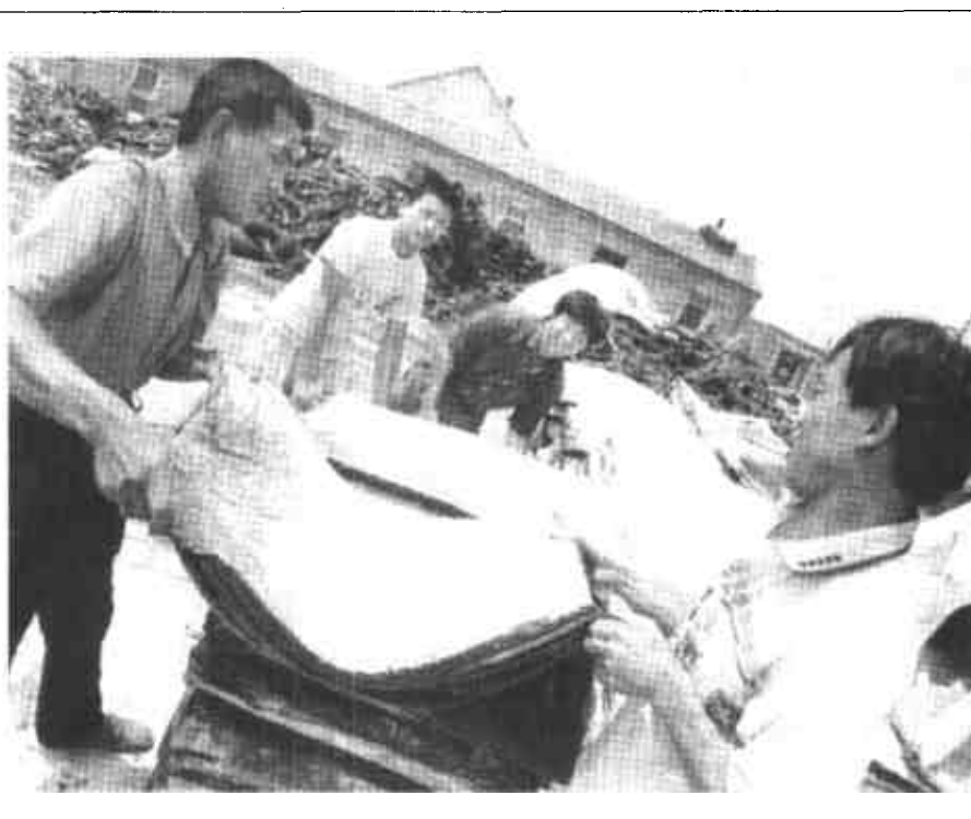
河口区孤岛镇党委、政府采取有效措施,加大招商引资力度,成果显著。上半年,该镇引进项目20个,到位资金4800万元,有14个项目已建成投产,在全区名列前茅。