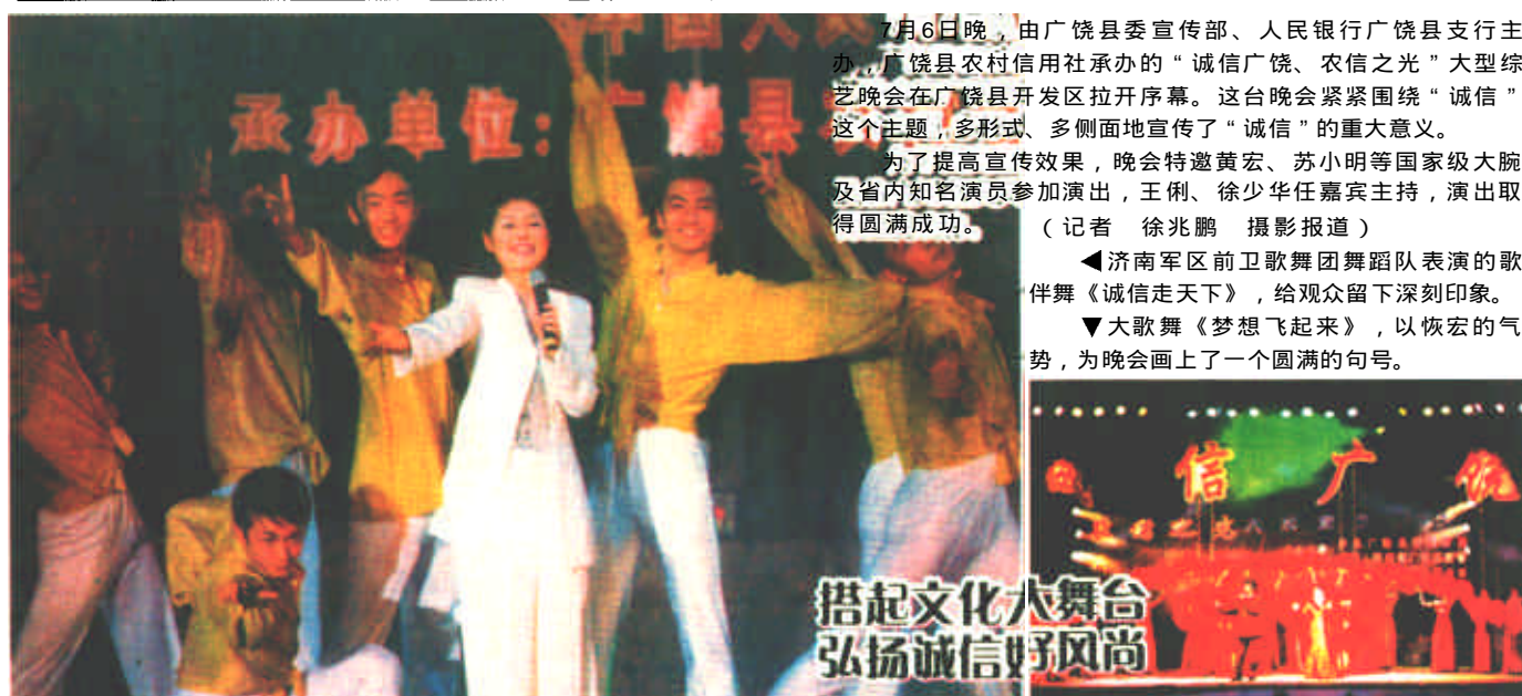
7月6日晚，由广饶县委宣传部、人民银行广饶县支行主办，广饶县农村信用社承办的“诚信广饶、农信之光”大型综艺晚会在广饶县开发区拉开序幕。这台晚会紧紧围绕“诚信”这个主题，多形式、多侧面地宣传了“诚信”的重大意义。为了提高宣传效果，晚会特邀黄宏、苏小明等国家级大腕及省内知名演员参加演出，王俐、徐少华任嘉宾主持，演出取得圆满成功。(记者 徐兆鹏 摄影报道)

本报讯 日前，我国首家滨海湿地自然保护区在我市破土动工。该博物馆全称中国滨海湿地自然保护区博物馆，是研究、宣传黄河三角洲自然保护区的机构，具有收藏、研究、教育等多种社会功能。据黄河三角洲自然保护区综合科学考察认定，自然保护区内现有各种野生动植物1921种，其中水生动物641种，属于国家重点保护的有斑海豹、松江鲈鱼等9种。有鸟类269种，其中属国家一级重点保护的有丹顶鹤、白头鹤、白鹤、大鸨、金雕、白尾海雕、中华秋沙鸭7种，属国家二级重点保护的有白天鹅、灰鹤、白枕鹤等34种。自然保护区内现有植物393种，属国家二类重点保护植物的野大豆在保护区内有广泛分布，面积达0.8万公顷，天然草场5.1万公顷，天然实生柳林700公顷，天然柽柳灌木林8100公顷，还有华北平原地区最大的人工刺槐林，面积达1.2万公顷。保护区地理位置优越，生态类型独特，是中国暖温带保存最完整、最广阔、最年轻的湿地生态系统，是东北亚内陆和环西太平洋鸟类迁徙重要的“中转站”越冬栖息地和繁殖地。黄河三角洲自然保护区管理局在经过认真考察论证后，经市政府批准，决定建设我国首家湿地自然保护区博物馆，全面展示、研究、收藏保护区内动植物生态，让更多的人了解黄河三角洲自然保护区。据了解，该馆位于沂河路与青州路交叉口，环城河局部放宽的水景区带，主要划分为展示功能区、收藏研究功能区、服务管理功能区和游览观赏功能区四部分。该馆的建设还充分考虑了我市正在建设的大旅游格局，将成为我市又一标志性建筑。在建筑设计上具有空间序列明确，流动性强，建筑形体构成成分重，美观大气，高科技品位浓厚等特点。预计该馆将于明年7月份建成，建成后必将成为我市又一著名旅游景点。(本报记者 田召斌 通讯员 陈陈锦)