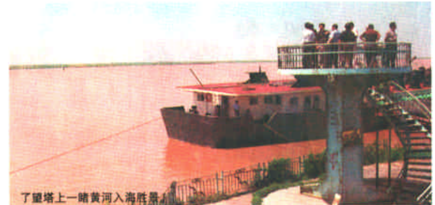
了望塔上一睹黄河入海胜景。