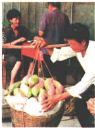
广西百色地区芒果目前进入成熟期。芒果比去年减产两成，但价格却不甚理想，果农们只好无奈地面对市场的波动。这位果农与收购商不讨价还价，准备另寻买主。