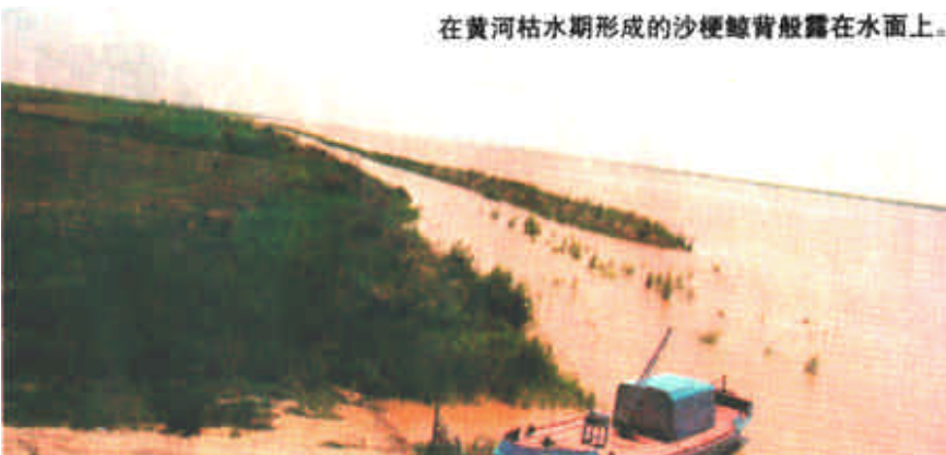
在黄河枯水期形成的沙埂背脊露在水面上。

水资源等。因此调水调沙的关键在一个“调”字，一是调流量，二是调含沙量，包括泥沙颗粒的粗细。