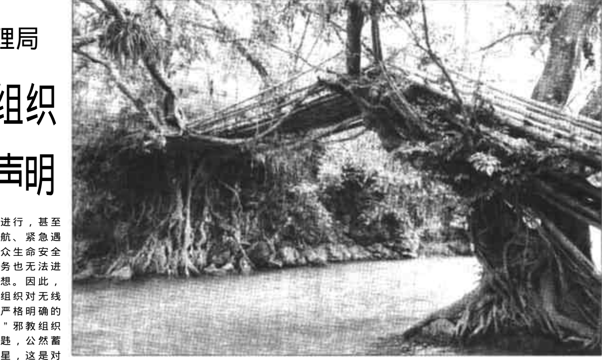
广西壮族自治区南丹县城关镇鸳鸯桥村有两棵隔河相对的古榕树，日久天长，其中一棵的须根跨过河抱另一棵的树干，形成“隔河古榕相拥抱”的奇观。村民们以榕树相抱的须根为依靠，架起了一座竹桥，作为村民们日常来往的交通便道。但是否应该保护，勿路短呵！

我们正告“法轮功”邪教组织，必须立即停止干扰正常通信的非法行为。我们呼吁国际社会对这种卑劣行径予以谴责，共同采取措施制止这种恶劣行径。